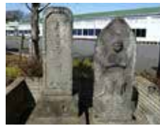
コース内にある古い石碑

野木駅から野木神社までの3.8kmの道のりをメンバー2人1組で地図を片手に歩きました。2人で協力し3か所のチェックポイントでクイズをクリアしながらゴールを目指します。道に迷ったメンバーをスタッフがかけまわって捜すハプニングもありましたが、全員無事にゴールの野木神社に着いたときは笑顔でした。また今回は各ポイントでスタッフへ電話連絡することで報告の練習もできました。