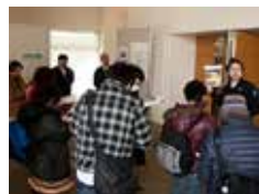
真剣に話を聴くメンバー

日時 平成26年3月8日(土) 8時30分—17時10分 場所 野木方面 参加者 16名(メンバー6名) 参加費 無料