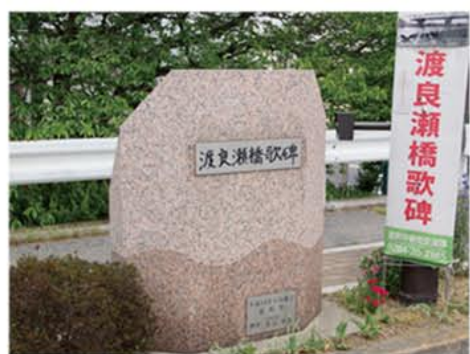
⑤ 渡良瀬橋歌碑 ⑥ からくり時計