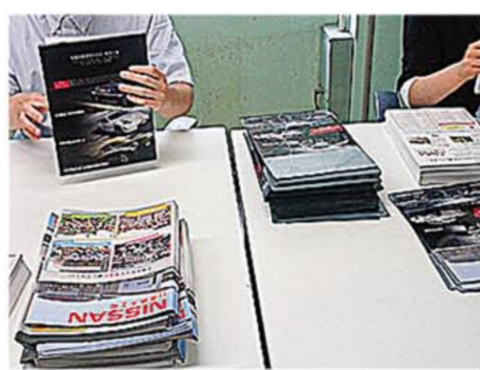
クリアファイルにパンフレットをセットする

今回の2名は、事業所外実習は初挑戦でしたが、仕事がりやすいように書類を配置し、作業していただきました。約1時間の作業でそれぞれ123セットと156セット完成させることができました。