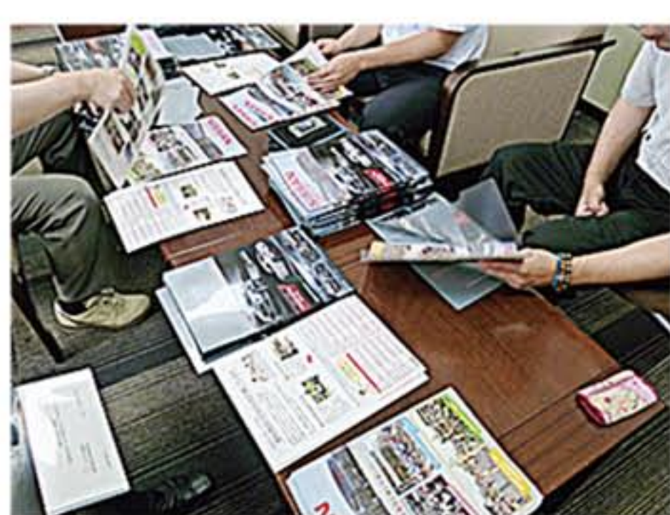
前回と同じくパンフレットをセットする業務

7月15日(水) (メンバー3名) 作業内容は前回と同じだったため、2回目の参加メンバーが初参加の2人に説明をする姿もありました。それぞれ62セット・125セット・144セット完成させることができました。