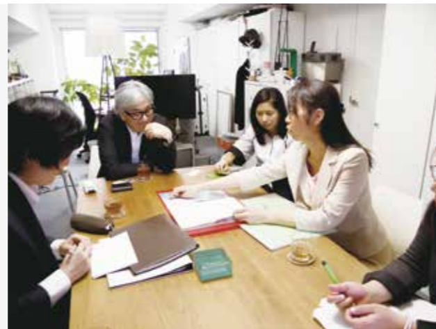
▲協力：株式会社 Trunk 様 (東京都港区青山)