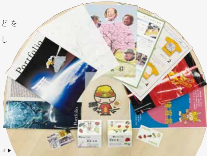
就職したメンバーのポートフォリオ▶