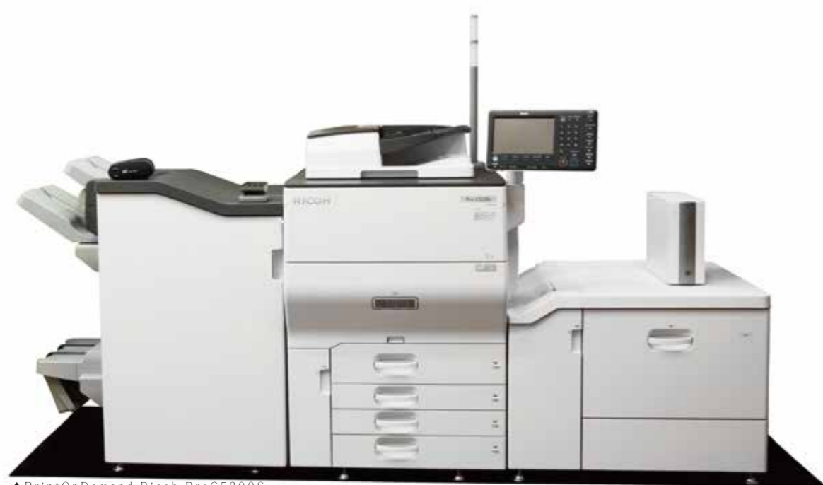
▲PrintOnDemand Ricoh ProC5200S

ここわ就労支援担当との面談をご希望の方は、以下シートにご記入いただいてからお電話いただけますとスムーズにご案内できます。（すべて記入する必要はありません。）