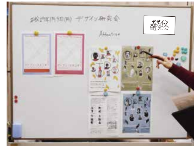
▲デザイン研究会の様子（事業所内）