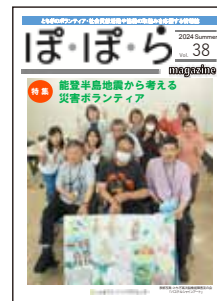
ぽぽらmagazine 2024 Summer Vol.38 表紙より

URL https://tochigikoujinou.sunnyday.jp/