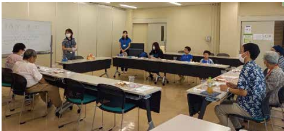
プリン作りの様子

食べながらおしゃべり会をしました。最近夢中になっていることなどをテーマに、得意なことや好きなこと、スポーツやドラマの話などで盛り上がりました。（大村）