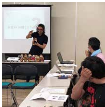
パソコン教室の様子