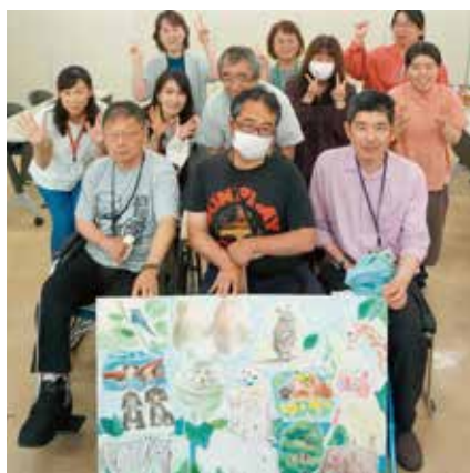
とちぎ高次脳機能障害友の会 「パステルシャインアート」

撮影していただいた写真が、「ぽ・ぽ・ら」2024年 Summer Vol.38 の表紙になっています。ぜひご覧ください。(大村)