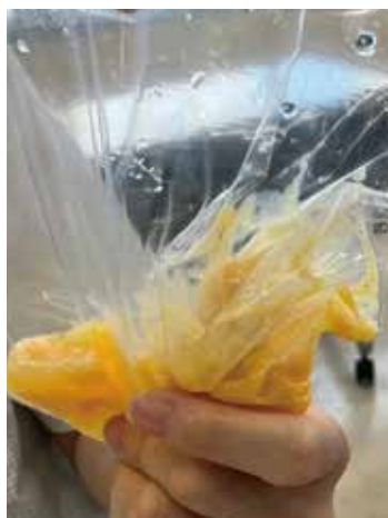
①ジップロックに入れてもむ